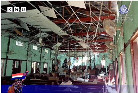
သူးမီးစီရိအသူးတဖှ် ဟဲခးလိတော်အယ် ဘာ်ဟးဂါဝဲ တာ်ဘါယူသရိာ် ဒီး ဟံာ်ဟးဂါဝဲ ၄ ဖျာ် ဝဲ ချာ်လွိုင်ထွာ်ကီရ်ရုာ် မူကီာ်ဆာ် (၂၀၂၃ နံာ် လါဒံာ်စုဘာ် ၇ သီ)