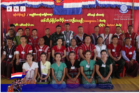
ကီးတရ်းကီာ်ဆာ် တာ်အိာ်ခိာ်ဖးဒိာ် (၁၀) ဝိတဝိ (၂၀၂၃ နံာ် လါဒံာ်စုဘာ် ၂၀-၂၂ သီ)