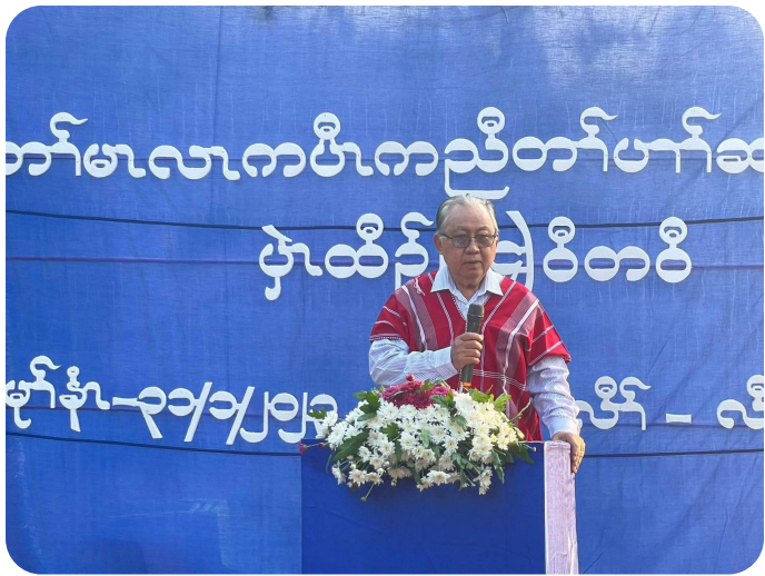
ခွန်အဲဉ်ယုဉ် ကရုဓိဉ် အတော်ကတီလီဆူထံဖိကီဖိကမျာ်အခိဉ် ဖဲလဲဉ်ခိဉ်စုတၢ် ၂၀၂၃ ခုဉ်

အဆိယဆာဂုဆာဝါဘဉ် ကညီဒီတကလုာ်ဃုာ်ဒီးထံဖိ ကီဖိကမျာ် လၢအိဉ်ဖဲကီတဘျုးအံအပူၤသ့တဖဉ် ကပွဲၤ ဒီးတၢ်ဂံၢ်တၢ်ဘါ, တၢ်အိဉ်ဆူဉ်အိဉ်ချ့, ကပူၤဖျးဒီးတၢ်ကီတၢ် ခဲ, တၢ်နးတၢ်ဖျိဉ်, တၢ်တတၢ်တနါ လၢဆာကတီခဲအံၤန့ဉ် လီၤ.