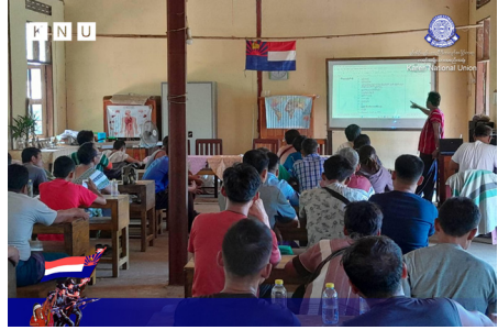
တာ်ဟံာ်ပျါဒူးသျာ်ညါဝဲ ခုာ်အိာ်ယုာ် ဟံာ်ခိာ်ကဟံာ်ကမံးတံာ် ဒီး ကီာ်သုလုာ်သျာ်ပျာ်ဝဲကျိာ် တာ်ဖဲတာ်မာတဖှ်ဆူ ဒုပျာ်ယာ်ကီာ်ရုာ် နီာ်တကီာ်ဆာ် ခိာ်နာ်တဖှ်အာ် (၂၀၂၃ နံာ် လါဒံာ်စုဘာ် ၂၃ သီ တုာ် ၂၆ သီ)