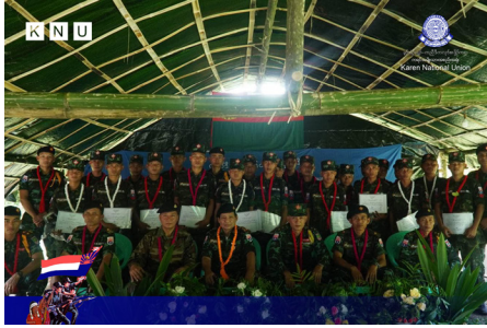
ကညီဒီကလုာ်တာ်ထွာ်ပျးသူးမျာ်ဒိာ် သူးယဲခိာ်တာ်မာလိပျာ်အမူး သူးကုနီာ်ဂံာ် (၃) တာ်မာလိအဆာကတီာ် (၂၀၂၃ နံာ် လါယူလဲ တုာ် လါဒံာ်စုဘာ် ၁ သီ)