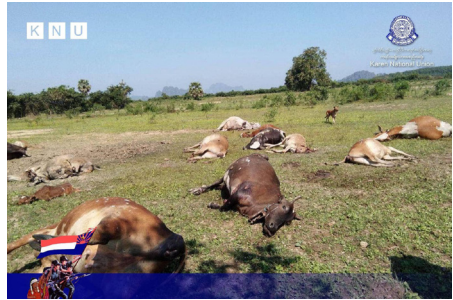
သူးမီးစီရိအသူးတဖှ် ခးနါစိကျိဖးဒိာ်အယ် ဘာ်သံဝဲကမျာ် အကျိာ် (၁၅) ဒု ဝဲ ဒုသထွာ်ကီရ်ရုာ်၊ သထွာ်ကီာ်ဆာ် (၂၀၂၃ နံာ် လါဒံာ်စုဘာ် ၃၀ သီ)