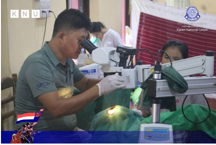
ဖှ်အာ်ကီာ်ရုာ်ခိာ်နာ်တဖှ် တီခိာ်ရိာ်ဖဲဒီး ရဲာ်ကျဲဝဲ တာ်ကူဝါယါဘျါ မာ်ချဲ (ဒီလီ) လာကမျာ်သျာ်တဖှ်အာ်ဂံာ် ဝဲဒုယီာ်ကီာ်ဆာ် (၂၀၂၃ နံာ် လါဒံာ်စုဘာ် ၂၂ သီ တုာ် လါဒံာ်စုဘာ် ၁ သီ)