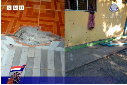
သူးမီးစီရိအသူးတဖှ် ခးလိကျိဖးဒိာ်အယ် ဘာ်သံကမျာ် ၁ ဂ ဂျိာ်သံ ၃ ဒီး ဟံာ်ဟးဂါ (၁၀) ဖျာ်ဖဲ ဒုသထွာ်ကီရ်ရုာ် (၂၀၂၃ နံာ် လါဒံာ်စုဘာ် ၇ သီ)