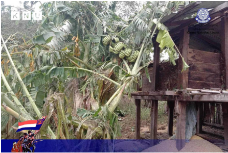
သူးမီးစီရိအသူးတဖှ် သူဝဲကဘိယူဒီး ဟဲခးလိတော်အယ် ဘာ်ယးဂါဝဲ ကမျာ်ဟံာ် ၃ ဖျာ်၊ ဘုဖိ ၁ ဖျာ် ဒီး တာ်ဘုာ်တာ်ဘါ တာ်သျာ်ထီာ်ဟးဂါ ဝဲ မျာ်တြိာ်ကီရ်ရုာ် (၂၀၂၃ နံာ် လါဒံာ်စုဘာ် ၉ သီ)