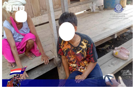
သူးမီးစီရိအသူးတဖှ် ဝဲကမျာ်လဲလိာ်ဘုခုအဆာကတီာ် ခးဝဲဒီးကျိ အယ် ဘာ်ဒိဝဲကမျာ်တဂအခိာ် ဝဲ ဒုပျာ်ယာ်ကီရ်ရုာ် (၂၀၂၃ နံာ် လါဒံာ်စုဘာ် ၁၂ သီ)