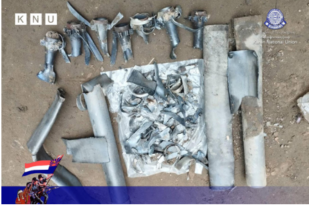
သူးမီးစီရိအသူးတဖှ် သူဝဲကဘိယူဒီး ဟဲခးလိတော်လါ ဒုသပီပူ အယ် ဘာ်သံဝဲ ကမျာ် ၁ ဂ ဝဲ ဒီး ဘာ်ဒိကမျာ် ၃ ဂဖ် ချာ်လွိုင်ထွာ် ကီရ်ရုာ် (၂၀၂၃ နံာ် လါဒံာ်စုဘာ် ၁၄ သီ)