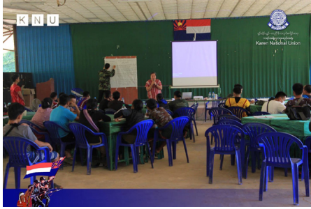
တာ်ဟ့ာ်နီုဖဲ ကညီဒီကလုာ်ဟးကီာ်သူးတဖှ် ဘာ်ထွဲ ခုာ်အိာ်ယုာ် တာ်ဘျာ်ခိာ်သျာ် ကျဲသနူ ဒီး ဝဲဒဲဒရုာ်ဂံာ်ခိာ်ထံးတာ်သျာ်ညါနာ်ဟါ (၂၀၂၃ နံာ် လါဒံာ်စုဘာ် ၁၄ သီတုာ် ၁၈ သီ)