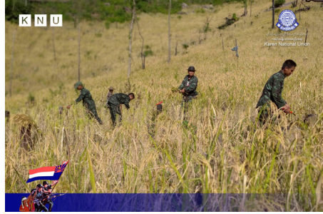
ကညီဒီကလုာ်တာ်ထွာ်ပျးသူးမျာ်ဒိာ် သူးကုနီာ်ဂံာ် (၃) သိာ်ဒုဒီးခိာ်နာ် တဖှ် ကူးစာသဝိဖဲအဘုဝဲ ချာ်လွိုင်ထွာ်ကီရ်ရုာ် (၂၀၂၃ နံာ် လါဒံာ်စုဘာ် ၁ သီ)